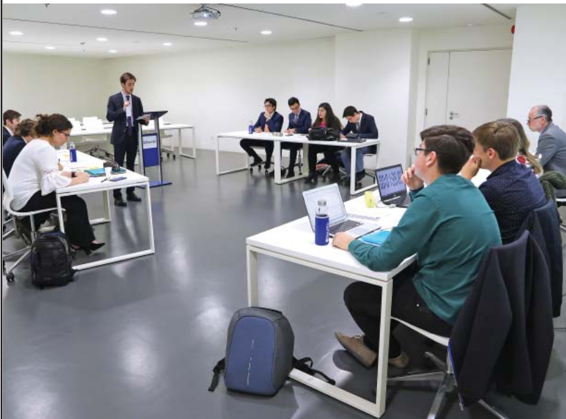
Liga debate academico Beato Garate edición 2019

Hoy también son tiempos de encrucijada y uno de los temas de nuestro tiempo está relacionado con la religiosidad. Vivimos un enorme proceso de secularización por el cual nuestro modo de ser sociedad, el modo de expresar la religiosidad y el modo de transmitirla se han convertido en algo totalmente inédito. En este contexto surge la pregunta que ha articulado la Liga de Debate en esta reciente edición: “¿Hace posible la sociedad española un crecimiento efectivo de la religiosidad en la juventud?”