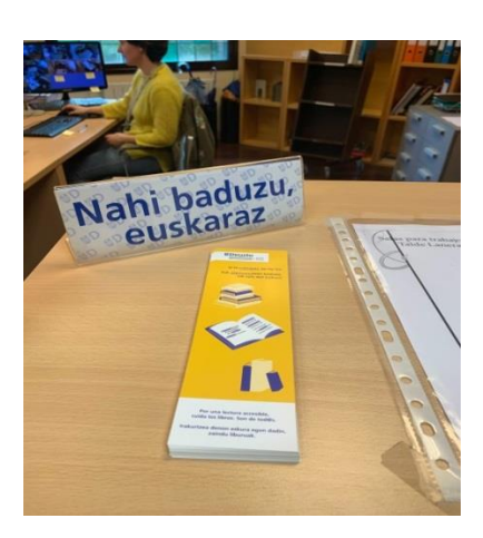
Campus San Sebastián