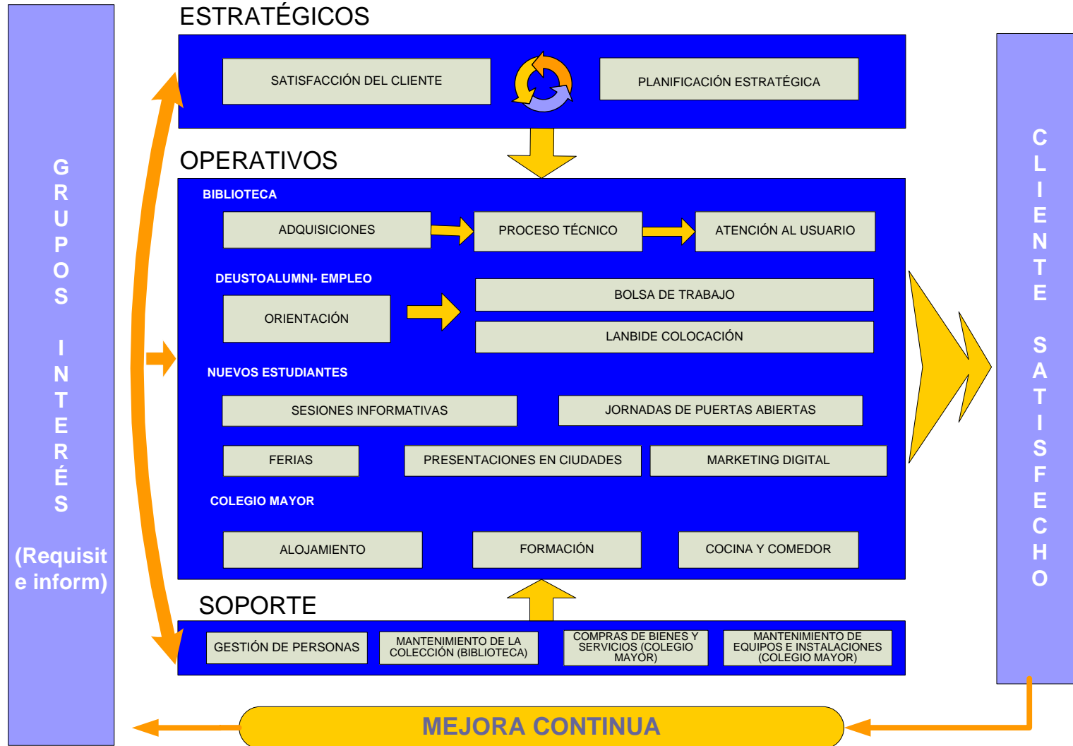
Figura 1. Mapa de procesos